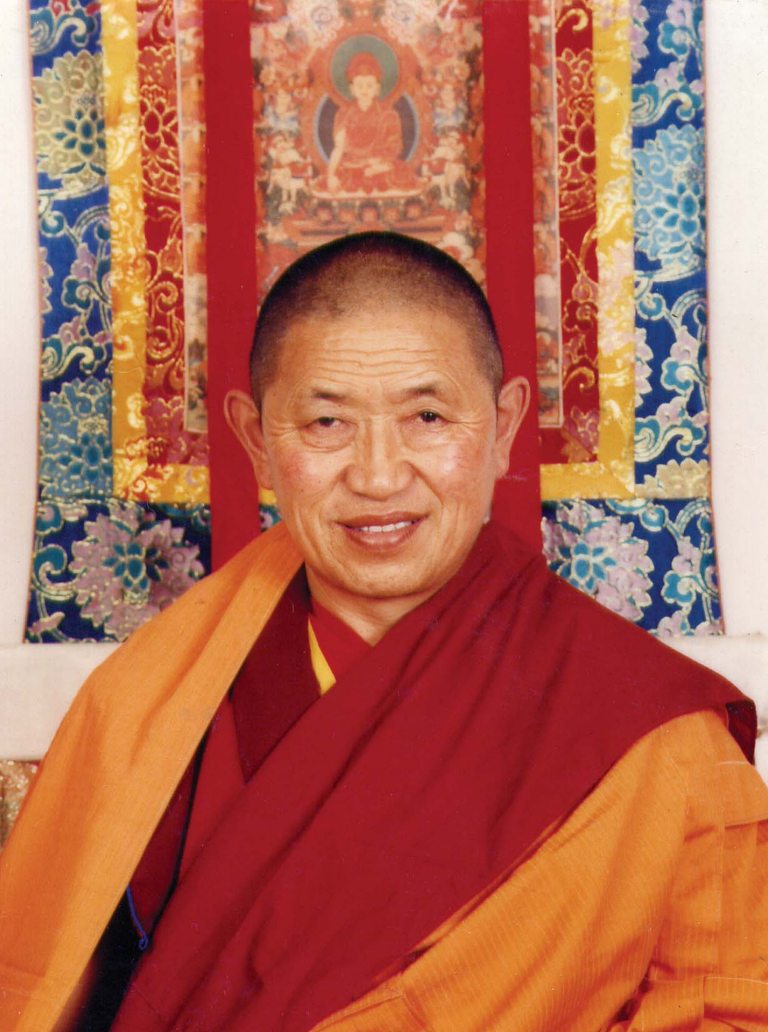
Его Преосвященство Гарчен Ринпоче